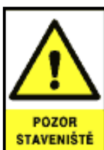
Obr. č. 1: Bezpečnostní a informační značení u vstupů a vjezdů na staveniště