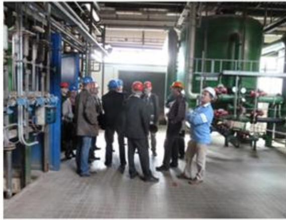
Obrázek č. 3: Fotografie z workshopu uspořádaného ve městě Strakonice